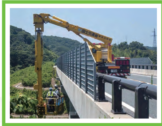
橋梁点検車を利用した診断