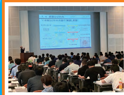
道路橋点検士技術研修会