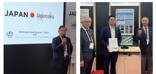
世界道路会議の様子

PIARC（世界道路会議） IABSE（国際構造工学会） fib（国際コンクリート連合会） IABMAS（橋梁の管理と安全に関する国際協会） JICA研修講師