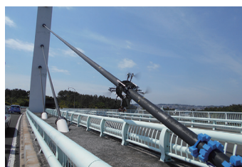
点検支援技術の例

性能カタログ掲載数(橋梁): 12(H31.3)→60(R2.6)→91(R3.10)→114(R4.9)→145(R5.3)